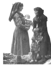
Plan. ¿Y los niños? (1920-1930)